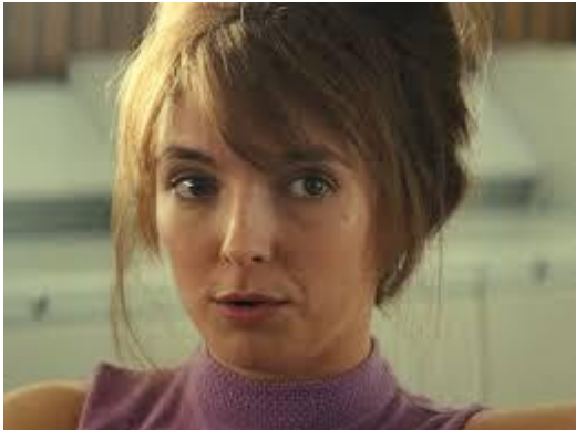
Kathy (gespeeld door Jodie Comer)