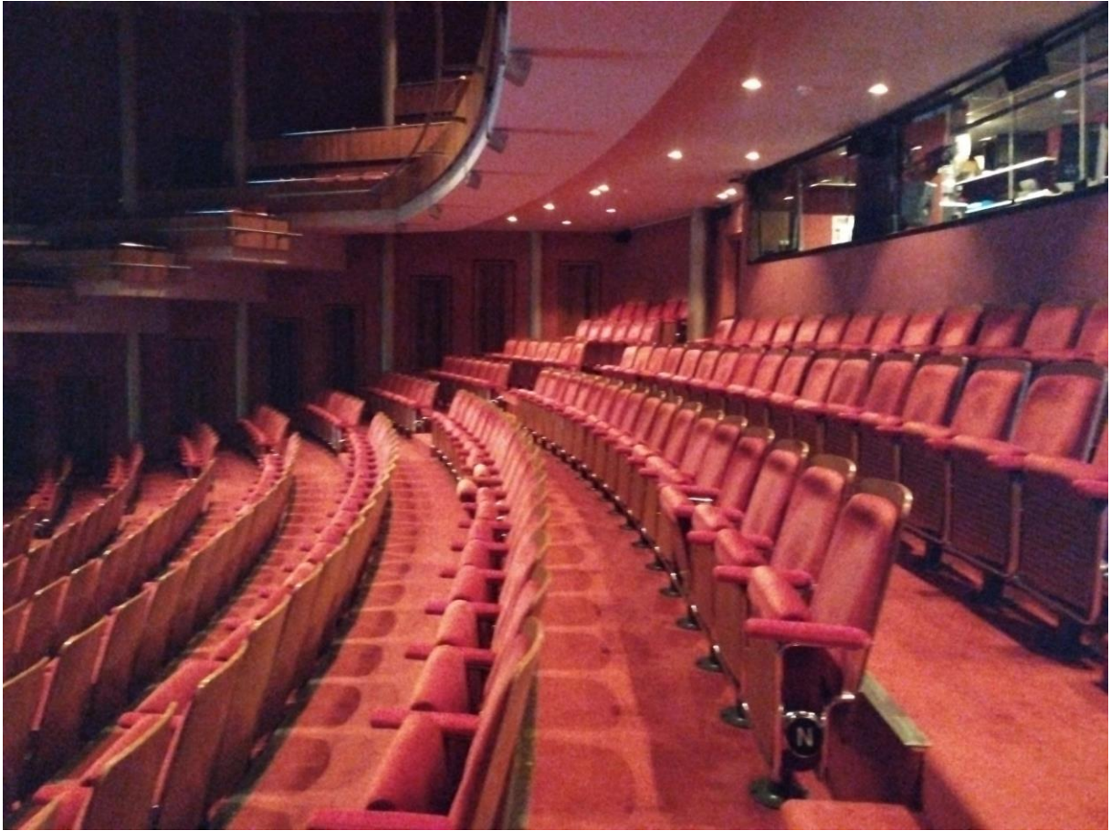
Voor film is de zaal vrije zit. Je kan zitten waar je wil