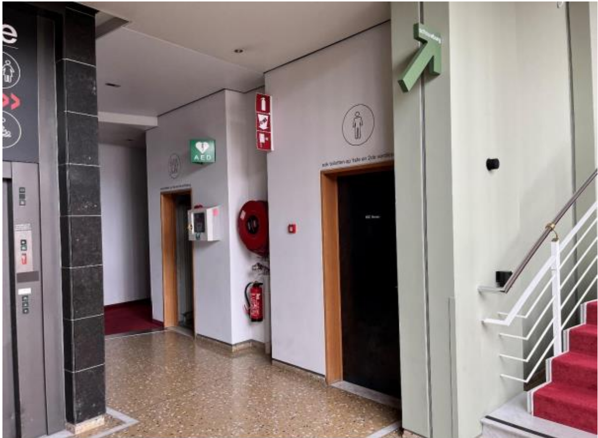
Dit is een foto als je iets dichterbij de wc's wandelt