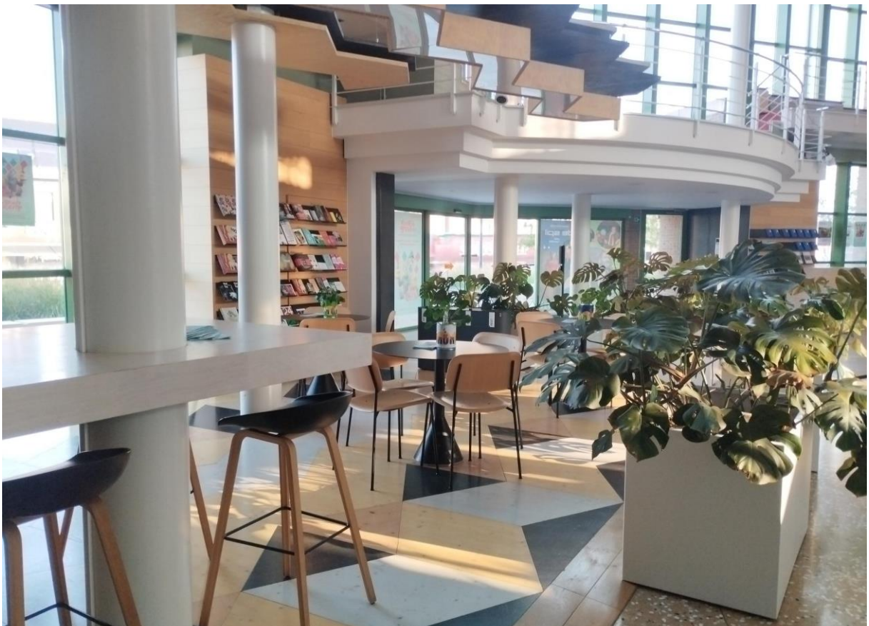
Wordt het je teveel dan kan je zaal verlaten en even tot rust komen in de leeshoek in de centrale hal.