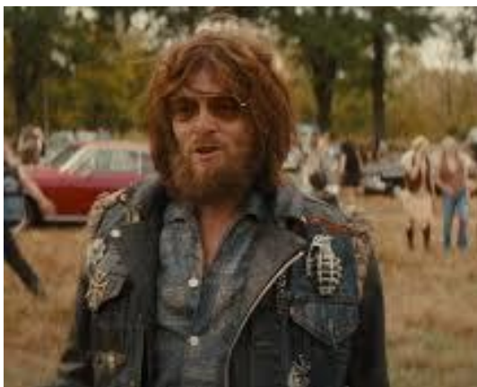
Funny Sonny (gespeeld door Norman Reedus)