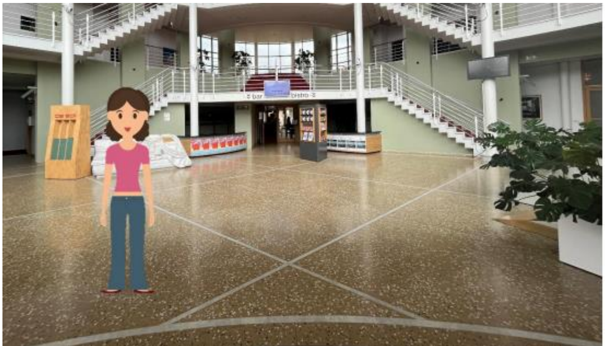
Dit is de inkomhal. Hier word je ontvangen door een medewerker van De Spil