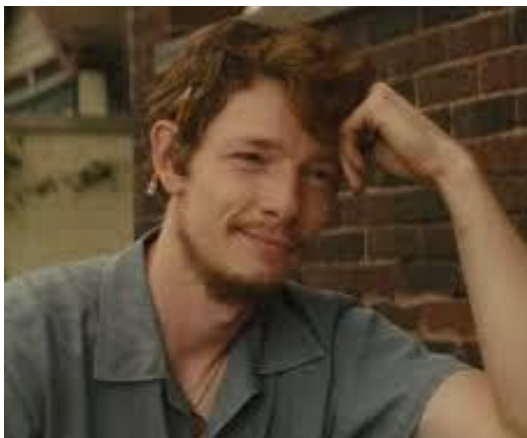
Danny Lyon (gespeeld door Mike Faist)