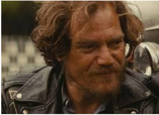
Zipco (gespeeld door Michael Shannon)