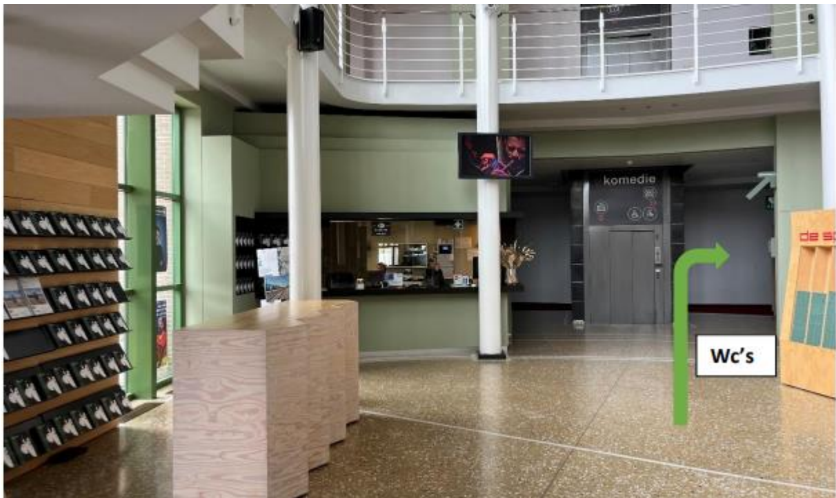
Als je naar links kijkt zie je de wc's