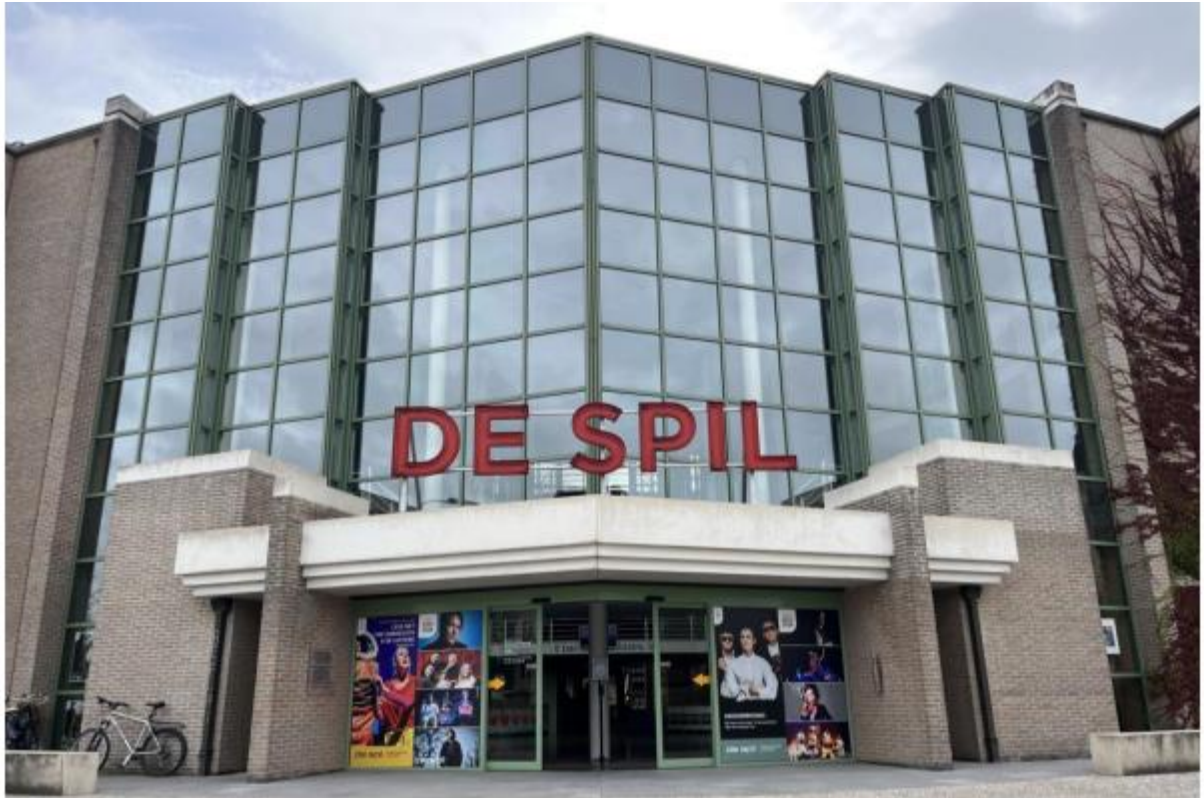
dit is de ingang van De Spil