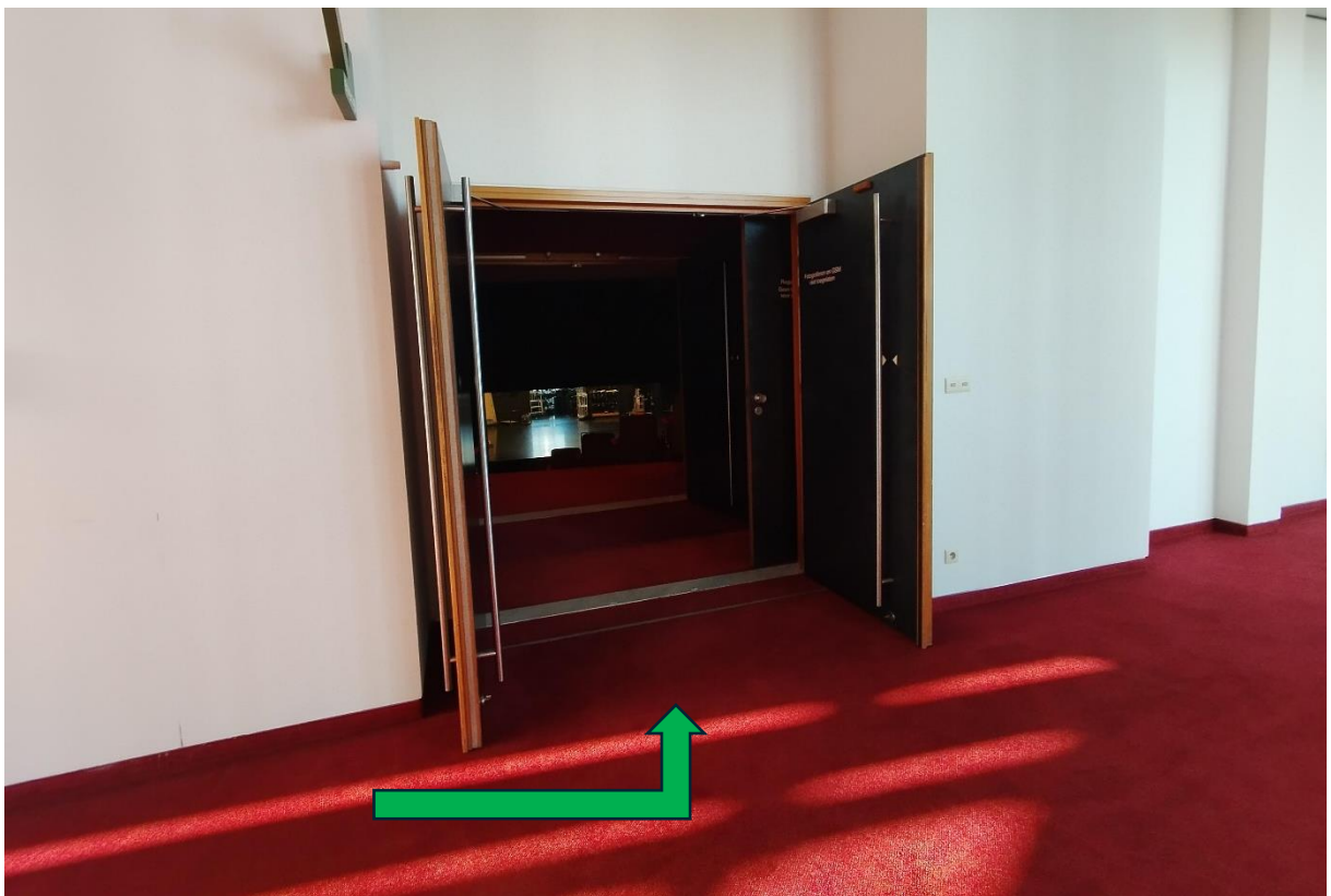
Via deze deuren ga je De Schouwburg binnen