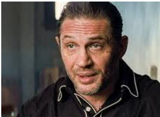
Johnny (gespeeld door Tom Hardy)