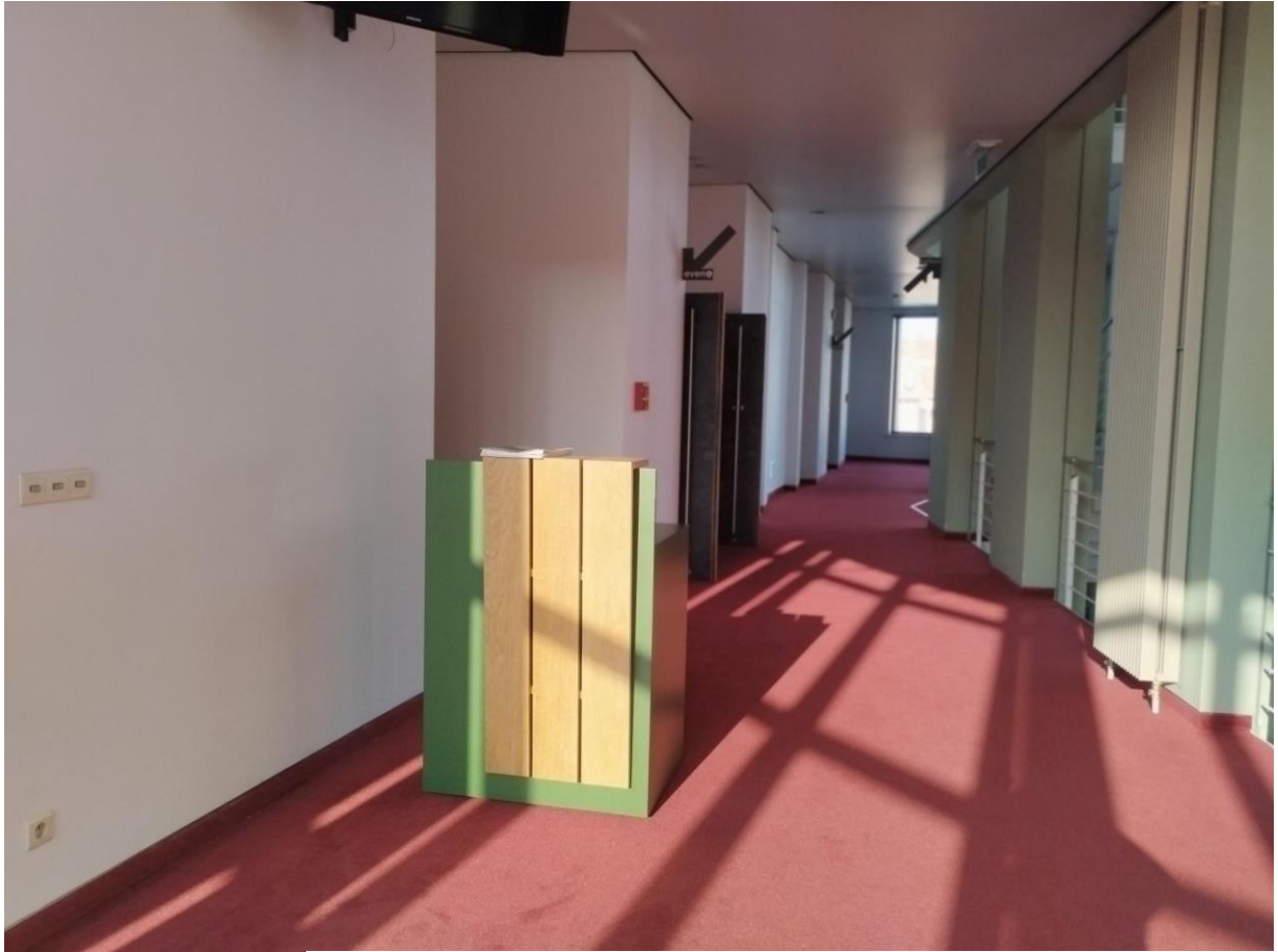
Bovenaan de trap is de ticketcontrole. Hier wordt je ticket gescand